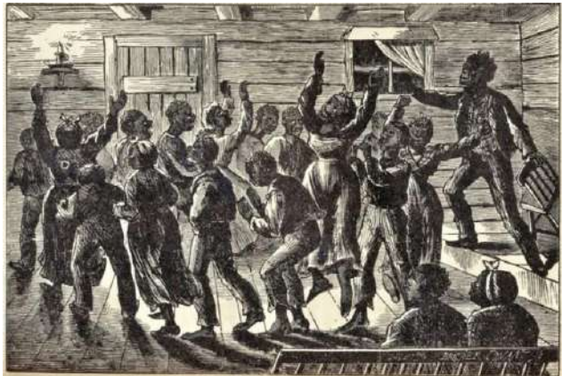
In het Praise House, na de dienst.

muziek; er wordt gezongen vanuit het hart en vanuit het lijf. Ondanks de veelheid aan Afrikaanse culturen en tradities heeft de muziek één gezamenlijk kenmerk: het gaat altijd om ritme en beweging.