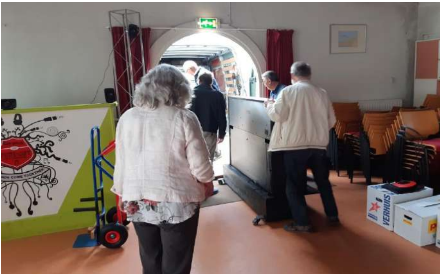
Verhuizing van de piano, van het Brandpunt naar de Jeugd van Gisteren