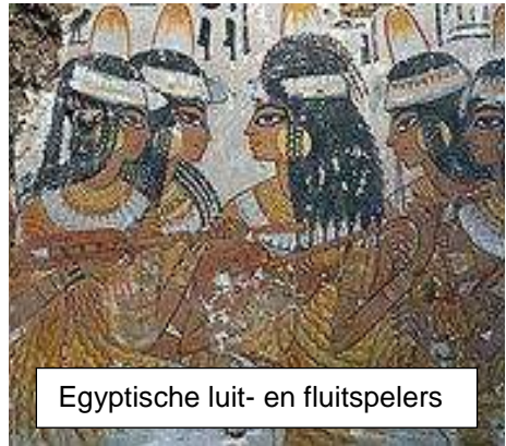
Egyptische luit- en fluitspelers

Wie eens flink duizelig wil worden, moet zich gaan verdiepen in de oude Indiase muziek. Daar worden zoveel toonsystemen en toonladders gebruikt dat er geen eenvoudig overzicht van te geven is. Zeventonig, twaalftonig, tweeëntwintigtonig en van alles daar tussenin. We zagen al dat van een van die zeventonige toonladders de 'onze' is afgeleid. Al stemmen wij die anders dan zij.