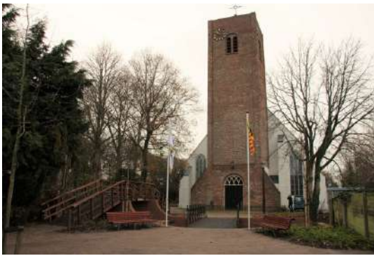
Allemanskerk Dorpsstraat 878, 1724 NV Oudkarspel

Hier is voldoende parkeer gelegenheid voor de kerk.