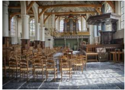
Broeker Kerk - Broek in Waterland